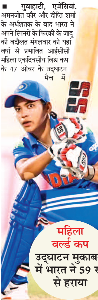
महिला वर्ल्ड कप उद्घाटन मुकाबले में भारत ने 59 रन से हराया

श्रीलंका को डकवर्थ लुईस पद्धति के तहत 59 रन से हराकर अपने अभियान की शुरुआत जीत के साथ की. डकवर्थ लुईस पद्धति के तहत भारत के 271 रन के लक्ष्य का पीछा करते हुए श्रीलंका की टीम ऑफ स्पिनरों दीप्ति (54 रन पर तीन विकेट) और स्नेह राणा (32 रन पर दो विकेट) तथा बाएं हाथ की स्पिनर श्री चरणी (37 रन पर दो विकेट) की बलखाती गेंदों के सामने 45.4 ओवर में 211 रन पर सिमट गई. कप्तान चामरी अटापट्ट 43 रन बनाकर टीम की शीर्ष स्कोरर रही जबकि निलाक्षिका सिल्वा ने 35 रन बनाए. भारत इससे पहले दो ओवर में चार विकेट गंवाये के बाद एक समय छह विकेट पर 124 रन बनाकर मुश्किल में था, लेकिन अमनजोत (57 रन, 56 गेंद, पांच चौके, एक छक्का) और दीप्ति (53 रन, 53 गेंद, तीन चौके) ने सातवें विकेट के लिए 103 रन की साझेदारी करके भारत को आठ विकेट पर 269 रन के चुनौतीपूर्ण स्कोर तक पहुंचाया.